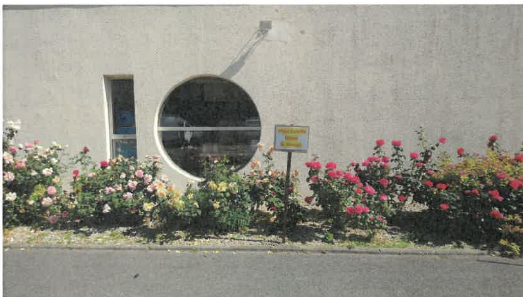
Accès à l'Ehpad pour les visites des familles. Indiqué par un panneau « visite famille Ehpad G. Raveau ».